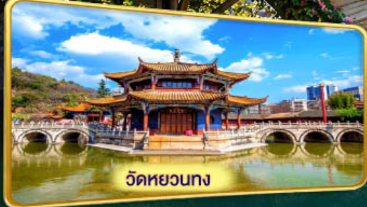
วัดหยวนกง