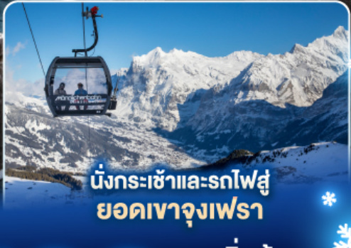
นั่งกระเช้าและรถไฟสู่ ยอดเขาจุงเฟรา