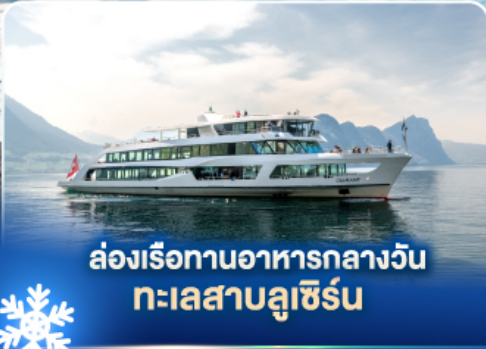
ล่องเรือทานอาหารกลางวัน ทะเลสาบลูซิิร์น