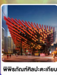
พิพิธภัณฑ์ศิลปะตะเกียบ