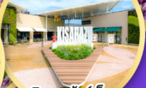
มิตซูเอะอิเกะอิชิอิ พาร์ค คิซะระซู