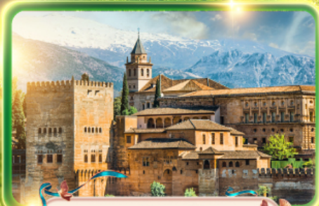
พระราชวังอาลัมบรา