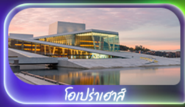
โอเปร่าเฮาส์