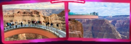
ชมความยิ่งใหญ่ของ GRAND CANYON WEST SKYWALK ราคาเริ่มต้น