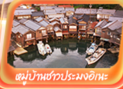
หมู่บ้านชาวประมงอิกะ