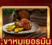
Ribs of Vienna, ปลาเทราสียง, อาหารหมูเยอรมัน