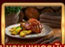
Ribs of Vienna, ปลาเทราสย่าง, ซาหุมเยอร์มิน

ตะลุยพิชิตยอดเขาทุกสปีซ "Top of Germany" เยือนเมืองมิกซ์ จัดดูสมาเรียนพลาทซ์ สัมผัสเมืองมรดกโลก เซสท์ ครุมลอฟ เยี่ยมชมปราสาทปราก ย้อนรอยอดีตซาลซ์บูร์ก สวนมิราเบล บ้านเกิดของโมสาร์ท ปราสาทบราติสลาวา มหาวิทยาลัยเซนต์มาร์ติน สุดโรแมนติกส่องเรือชมความงามแม่น้ำดานูบ จัดดูสวีเดนบูช พระราชวังฮอฟบวร์ก ขึ้นดากับความน่าหลงใหลของ หมู่บ้านริบทะเลสาบฮัลล์สตัดท์ พระราชวังเซินบรุนน์ ปิดท้ายช้อปปิ้งจุใจ