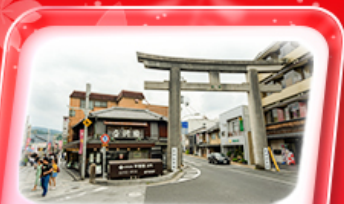
ถนนซ่าเซ็งว