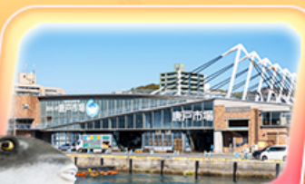
ตลาดปลาคาราโตะ