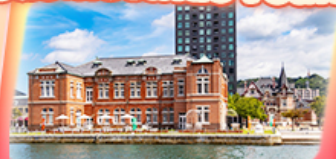
มิซึโกชิ อิเซโตะ

สายการบิน Vietjet Air (VZ) น้ำหนักกระเป๋า 20 KG