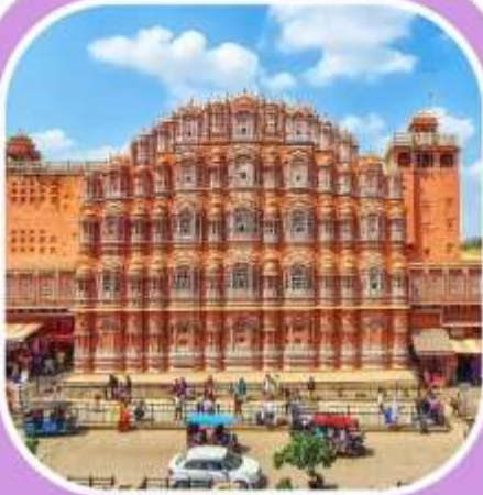
พระราชวัง แห่งสายลม

The world is a book, and those who do not travel read only one page.