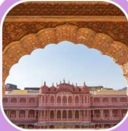
พระราชวังและ พิพิธภัณฑ์เมือง