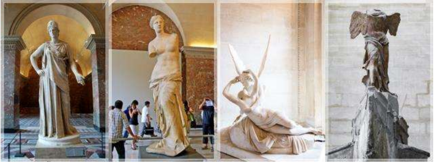
รูปปั้นวินัส เดอมีโล, รูปแกะสลักทาสของไมเคิล แองเจโล ฯลฯ ประติมากรรมเข้าตรงกลางครอบไว้ด้วยปิรามิด

กระจกซึ่งเพิ่งก่อสร้างเพิ่มเติมขึ้นมาในปี ค.ศ.1989 นำท่านเก็บภาพ ปิรามิดกระจก ซึ่งเพิ่งก่อสร้างเพิ่มเติมขึ้นมาในปี ค.ศ. 1989 ของพิพิธภัณฑลูปท์เป็นที่ระลึก “ย่านมองมาร์ต” (Montmarte) เป็นเนินเขา สูง 130 เมตร ทางเหนือของปารีสและเป็น จุดที่สูงที่สุดของเมือง ชม “มหาวิหารซาเคร เกอร์” (Bassilica of Sacre Coeur) หรือ วิหารพระหฤทัย ที่สร้างขึ้นเพื่อเป็นอนุสรณ์ สถานที่อุทิศแด่ชาวฝรั่งเศส ที่เสียชีวิตจาก สงครามกับป รัสเซีย ออกแบบตามแบบ ศิลปะสไตล์โรมัน - ไบเซนไทน์ Roman-Byzantine สีขาวสวยเด่นเป็นสง่าบนเนิน เขามองมาร์ต อีสระให้ทุกท่านได้เพลิดเพลิน กับบรรยากาศแบบชาวปารีสเชียง ในย่านมอง มาร์ตตลอดสองข้างทางจะเต็มไปด้วยร้าน กาแฟสไตล์ปารีสเชียง อีสระให้ท่านได้เดินชม บรรยากาศ และเลือกซื้อของที่ระลึกต่างๆ