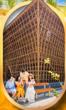
อาคารไม้ไผ่