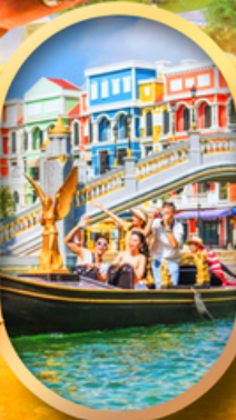
เวนิสแห่งเวียดนาม