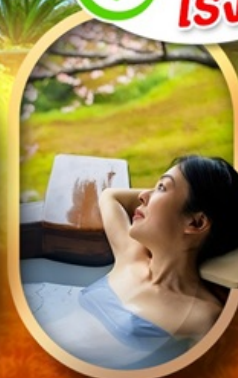
แช่ออนเซ็นญี่ปุ่น