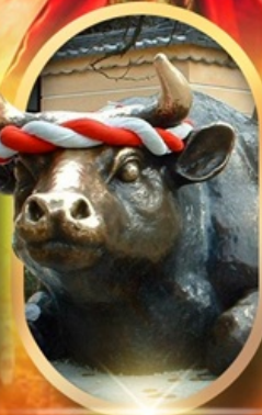
ศาลเจ้าคาโซฟู