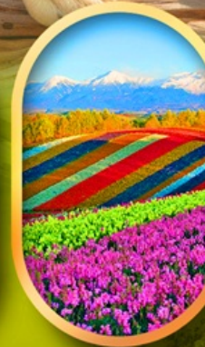
สวนดอกไม้ชิชิโซ