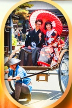
เมืองเก่าทาคายามา