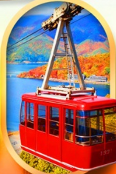
ขึ้นกระเช้าทะเลสาบมิกะตะ