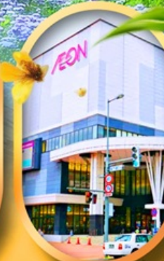
อีออนมอลล์