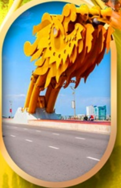
สะพานมังกรดามัง