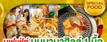
บุฟเฟ่ต์ บันบานาฮิลล์ 1 มื้อ และ บุฟเฟ่ต์ บาบิวบึงย่าง เดินทาง มี.ค. - ต.ค. 69