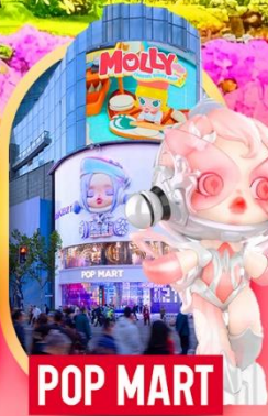
ช้อปปิ้งถนนหนางจิง