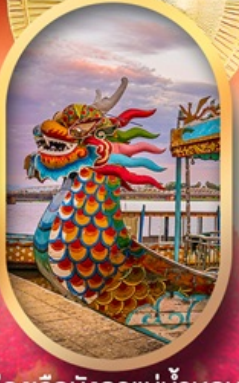
ล่องเรือมังกรแม่น้ำหอม