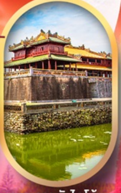
พระราชวังไคโน้ย