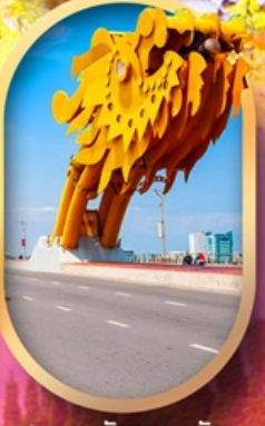
สะพานมังกรดานัง