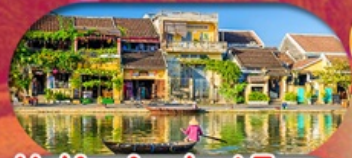
HoiAn Ancient Town ย่านเมืองเก่าฮอยอัน