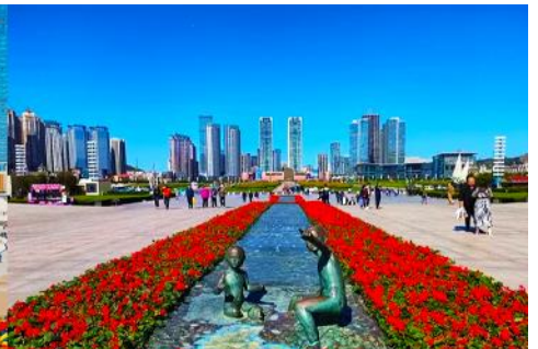
จัตุรัส星海

จากนั้นนำท่านเที่ยวชม จัตุรัส星海 星海广场 เป็นจัตุรัสขนาดใหญ่เป็นแลนด์มาร์คสำคัญของเมืองต้าเหลียน สร้างขึ้นเพื่อเฉลิมฉลองในโอกาสที่รัฐบาลอังกฤษคืนเกาะฮ่องกงในให้จีนในปี ค.ศ. 1997 ตั้งอยู่ชายฝั่งทะเลในเมืองต้าเหลียน เป็นจัตุรัสใจกลางเมืองที่ใหญ่ที่สุดในโลกและเป็นแลนด์มาร์คของเมืองต้าเหลียน รายล้อมด้วยตึกกระฟ้าที่ทันสมัย ภายในมีบ่อน้ำพุดนตรี ลานหญ้าขนาดใหญ่ และลานกว้างสำหรับจัดกิจกรรมกลางแจ้ง อาทิ เทศกาลเบียร์นานาชาติ การแข่งขันวิ่งมาราธอน งานแฟชั่นนานาชาติเมืองต้าเหลียน ฯลฯ