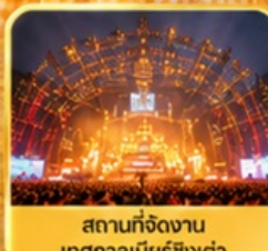
สถานที่จัดงาน เทศกาลเบียร์ชิงเต่า