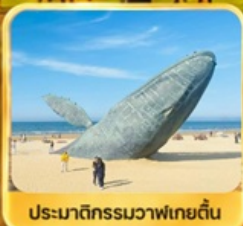
ประมาติกรรมวาฬเกยตื้น