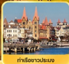
ท่าเรือชาวประมง