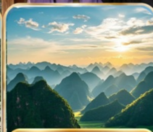
อุทยานป่าภูเขาหมื่นยอด (รวมรถแบตเตอร์ )