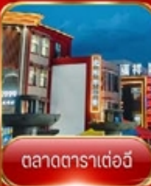
ตลาดตาราเตอวี