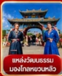
แหล่งวัฒนธรรม มองโกเลียหลวง