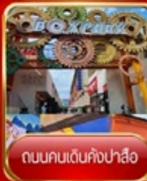
ถนนคนเดินคังปาสือ