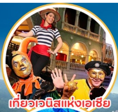
เที่ยวเอเชีย