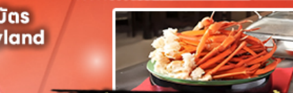
บุฟเฟ่ต์อาหารเย็น + ชาปู 1 มื้อ

Air Asia บินตรง นาริตะ เครื่องบินลำใหญ่ 370 ที่นั่ง