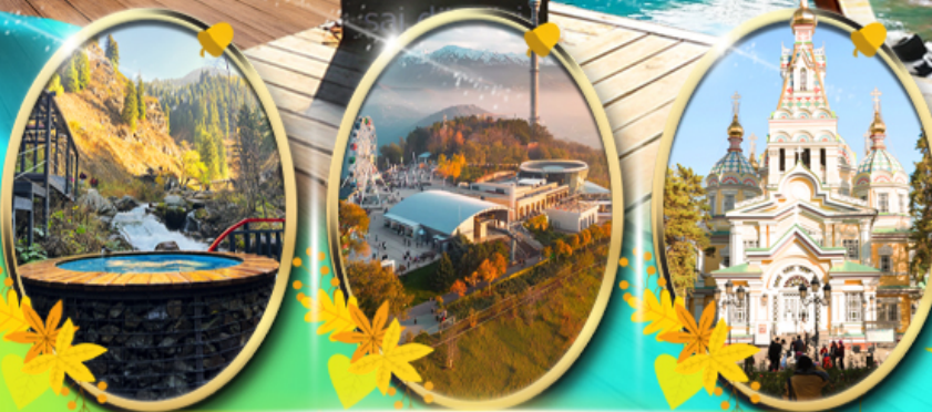
Alma Arasan Gorge Kok Tobe Zenkov Cathedral

เที่ยวครบทุกไฮไลท์ ครบ 15 ตำแหน่ง ไฮไลท์ พิเศษ! พักโคลโซ 1 คืน พักอัลมาตี 3 คืน