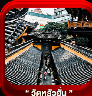
“ วัดหลิวฮั่น ”