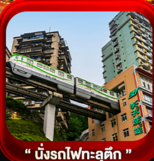
“ นั้งรถไฟทะลุตึก ”

บินตรงลงธงชัย • อุ๋หลง หลุมฟ้าสะพานสวรรค์ • ระเบียงแก๊ว • อุทยานเขานางฟ้า หงหยาดัง • นั้งรถไฟทะลุตึก • ศาลาประชาม (ด้านนอก) • หลงหมินฮ่าว มรดกโลกผาหินแกะสลักต้าจู่ • วัดหลิวฮั่น • ตึกตะเกียบ • หมู่บ้านโบราณสี่ซีโหว่