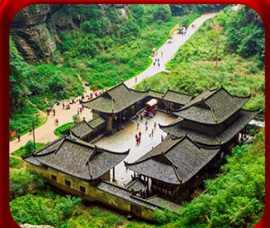
“อุทยานหลุมฟ้าสะพานสวรรค์”

T2G-CKG27CZ Best of Chongqing...ฉงชิ่ง ต้าจู้ อุ้หลง อุทยานหลุมฟ้า เขานางฟ้า 6D 4N (CZ)