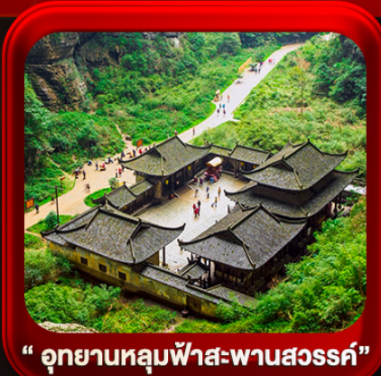
“ อุทยานหลุมฟ้าสะพานสวรรค์ ”