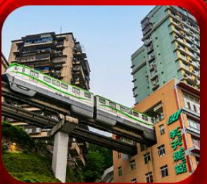
“นึ่งรถไฟกะลุดัก”