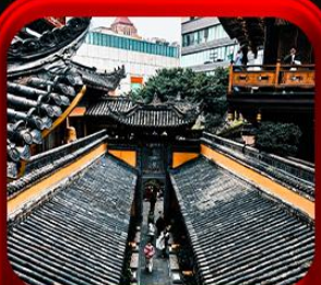
“วัดหลิวอัน”