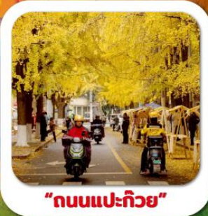
"ถนนแปะก๊วย"

นั่งกระเช้าชมภูเขาหวงอู่ซาน ขุนเขาใบไม้แดงอันดับหนึ่งของประเทศจีน เมืองชู่หนิง วัดหลิงจวน (วัดเจ้าแม่กวนอิมกะพริบตา) - พาสินแกะสลักต้าจู้ หงหยาดัง ถนนแปะก๊วย ตึกตะเกียบ วัดหลัวซัน ล่องเรือชมวิวฉงชิ่ง