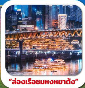
"ล่องเรือชมหงหยาดัง"