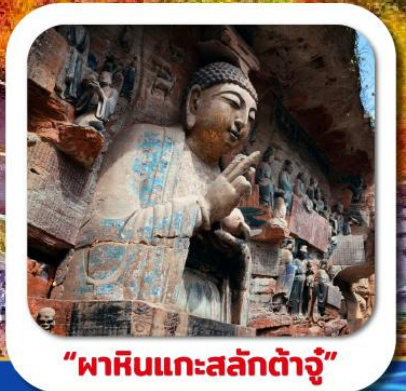
"พาสินแกะสลักต้าจู้"