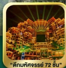
"ตึกมหัศจรรย์ 72 ชั้น"

นั่งกระเช้าชมภูเขาเทียนเหมินซาน • กำประตูล่องเรือ • ทางเดินกระจก เมืองโบราณเฟิ่งหวง • เมืองโบราณฟูหลงเจิน • ชมโชว์จิ้งจอกขาว ภูเขาเทียนจื่อซาน (รวมลิฟต์แก้ว) • หุบเขาอวตาร • ตึกมหัศจรรย์ 72 ชั้น