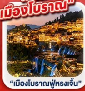
“เมืองโบราณฟูหรงเจิน”