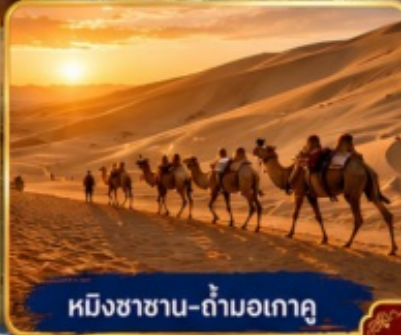
หมิงซาฮาน-กำมอเกา