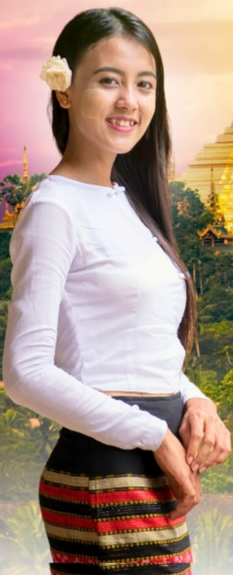
เจดีย์เยเลพญา