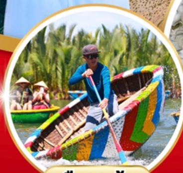
เรือกระด้าง