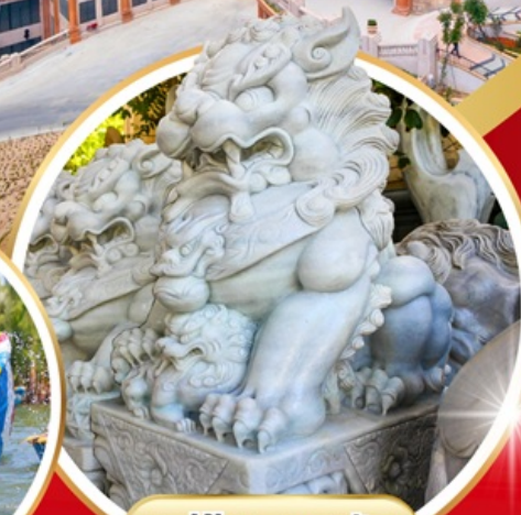
หมู่บ้านแกะสลัก