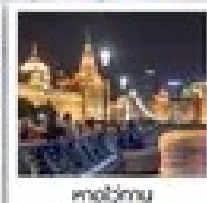
วัดอูเจิ้น