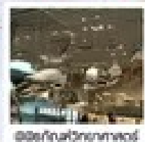
พิพิธภัณฑ์วิทยาศาสตร์