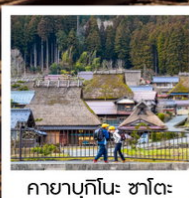
คายาบุกิโนะ: ซาโตะ