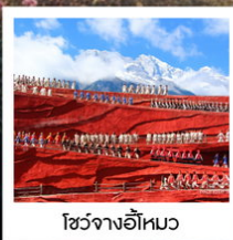
โซ่วจางอีไห่