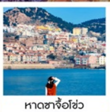
หาดซาจื่อฮั่ว