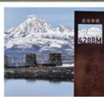
ปาหลางดิงตุ