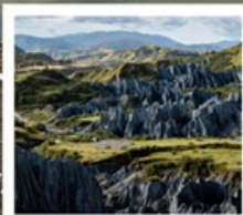
สวนหินปาเหมย์