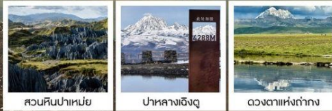
สวนหินป่าเหม่ย