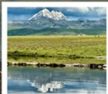
ดวงตาแห่งต่ำทง