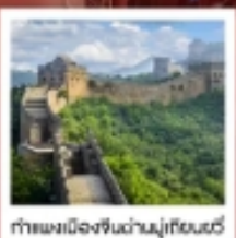
กำแพงเมืองจีนด่านมู่เทียนยวี่