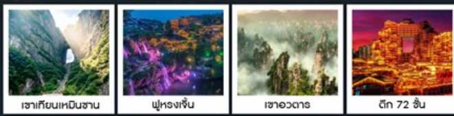
เขากิ๊ยนเหมินซาน ฟูหรงเจิ้น เขาวตาร ตึก 72 ชั้น

ล่องเรือลำน้ำถั่วเจียงชมเมืองฟ่งหวงยามค่ำคืน / สะพานสายรุ้ง / เมืองโบราณฟ่งหวง น้ำตกฟูหรงเจิ้น / เขากิ๊ยนเหมินซาน / ระเบิดมังกร / ประตูละคร / ไร่ชาฉางจื่อจอก ตึก 72 ชั้น / แกรนด์แคนยอน / สะพานแก้ว / เขาวตาร / สวนจอมพลเอ่อหลง ห้างเวินเหอโฮ่ว / ถนนหวงซิงลู (POP MART) / ซุปบิงเอ๋อเล็กอางซา