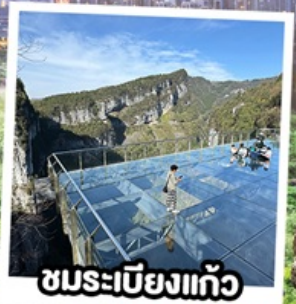
ชมระเบียบแก้ว