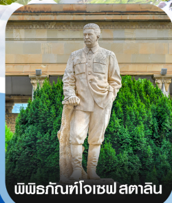
พิพิธภัณฑ์โจเซฟ สตาลิน