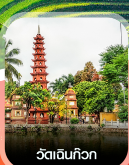
วัดอินทก๊วก

✈️ คอนเฟิร์มออกเดินทาง ทุกพีเรียด 2 ท่านขึ้นไป