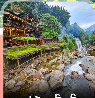
หมู่บ้านก๊วกก๊วก