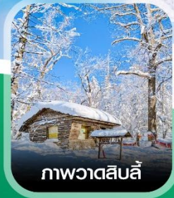
ภาพวาดสีบลู