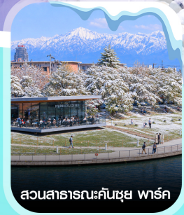
สวนสาธารณะคินซุย พาร์ค