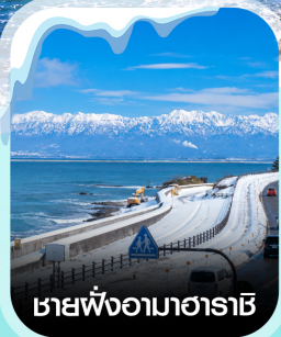
เขายั้งอามาฮาระชิ

✈️ คอนเฟิร์ม ออกเดินทาง ✈️ ทุกพีเรียด 2 ท่านขึ้นไป