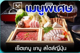
เชิเตาบู ซาบู สีสต์ญี่ปุ่น