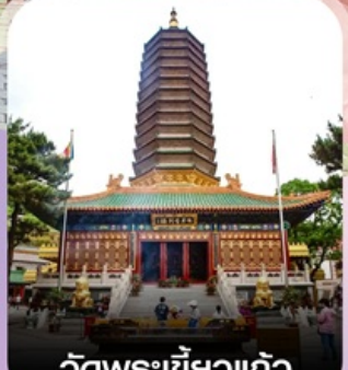
วัดพระเขี้ยวแก้ว