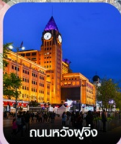
ถนนหวังฟู่จิ้ง

✈️ คอนเฟิร์ม ออกเดินทาง ทุกพีเรียด 2 ท่านขึ้นไป