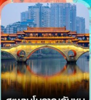
สะพานโบราณอันชุน