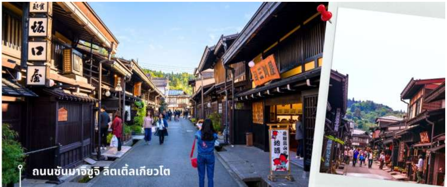
ถนนซันมาจิซุจิ ลิตเติ้ลเกียวโต

จากนั้นให้เวลาท่านเดินเล่นสัมผัสบรรยากาศกันต่อที่ ถนนซันมาจิซุจิ ซึ่งถูกขนานนามว่าเป็น “ลิตเติ้ลเกียวโต” บ้านไม้โบราณโทนสีน้ำตาลดำ เรียงรายไปตามทางเดิน มีคูน้ำอยู่รอบเมือง ปัจจุบันได้มีการปรับเปลี่ยนเป็นร้านค้า ร้านอาหาร ของที่ระลึก สำหรับนักท่องเที่ยวให้ได้เลือกชมทั้ง ผ้าแฮนด์เมด ชูดยูกาตะ ตุ๊กตาซารุโอะโอะ